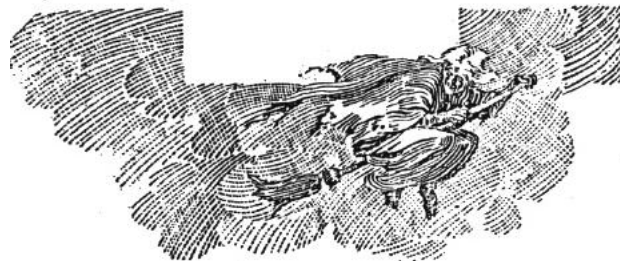
Table des matières du " Diable en Belgique " Roberto J. PAYRO (ou Payró ) : IEA3637 PARTIE 1 (pages I-37 : "LE DIABLE ARCHITECTE", "UNE CREATURE D'APOCALYPSE" (LE "VERT-BOUC"), "LE PACTE AVEC LE DIABLE", "LE STRATAGEME DE SAINT-REMACLE", "LE TILLEUL DES PENDUS" et "LE SORCIER DU CONDROZ".) :